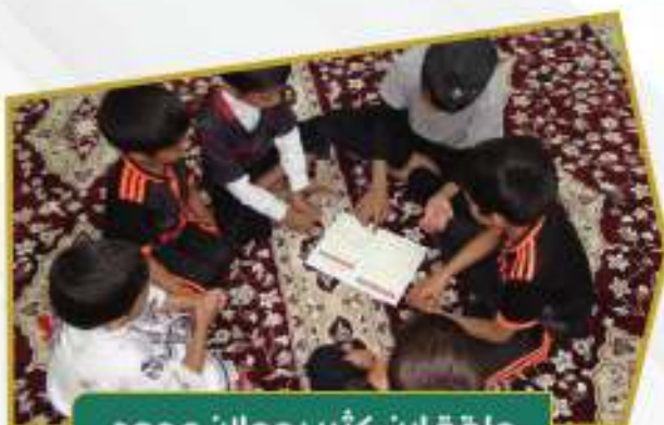
حلقة ابن كثير بجحلان عمود