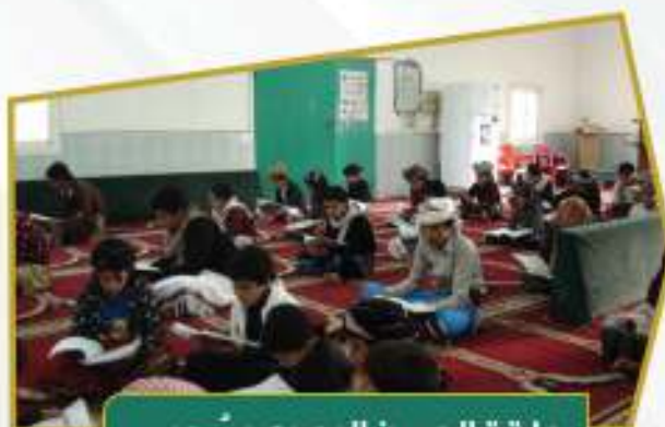
حلقة الحسن البصري بسحب