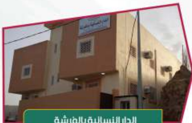
الدار النسائية بالفرشة