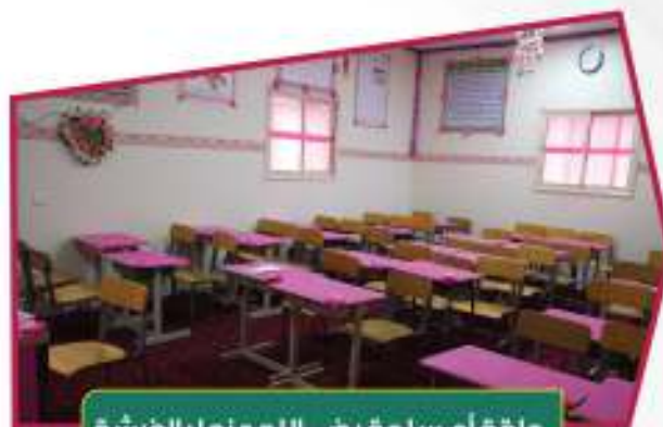
حلقة أم سلمة رضي الله عنها بالفرشة