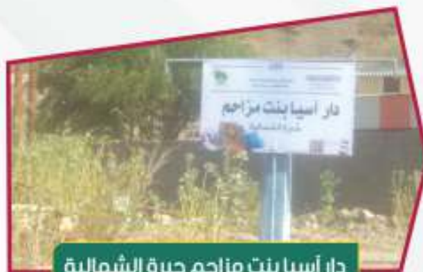
دار أسيا بنت مزاحم حبرة الشمالية