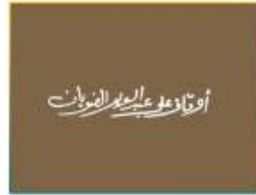
اوقاف الضويان الخيرية