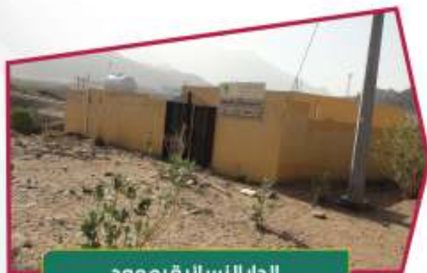
الدار النسائية بممود