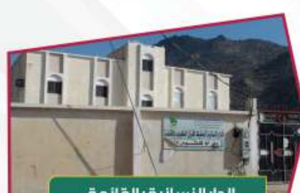
الدار النسائية بالقائمة