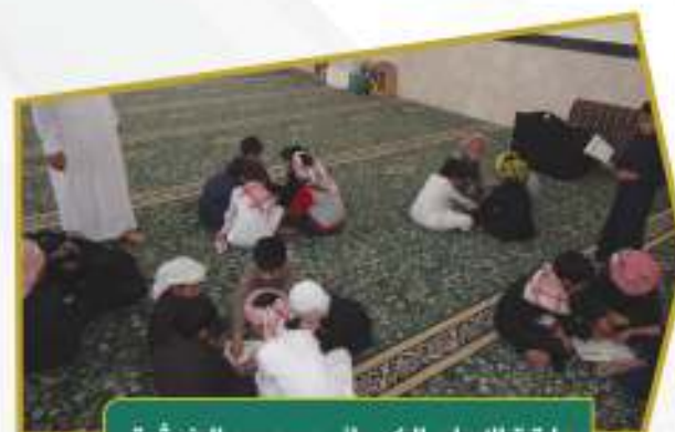
حلقة الإمام الكسالي بمجمع الفرشة